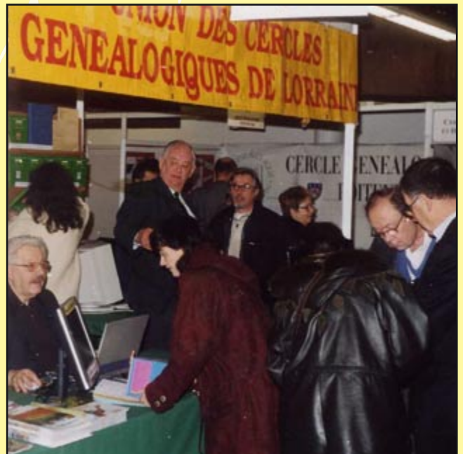
L'Union des cercles généalogiques lorrains à la biennale de généalogie de Paris en décembre 2002

Jean-Pierre MASSERET Président du Conseil Régional de Lorraine