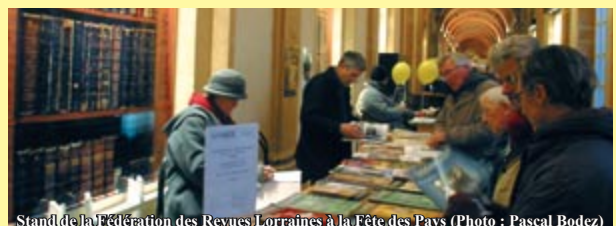
Stand de la Fédération des Revues Lorraines à la Fête des Pays

Président : M. Stéphane WIESER Courrier : 5 bis, place du Jet d'eau 54520 Laxou Contact : stephane.wieser@gazette-lorraine.com