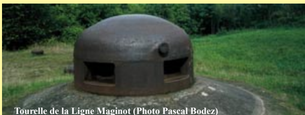
Tourelle de la Ligne Maginot

Secrétaire général : M. Michel MANSUY Courrier : 32, rue des Tilleuls 57070 Metz-Vallières Contact : lafasf@wanadoo.fr Site : www.fortifications-info.com