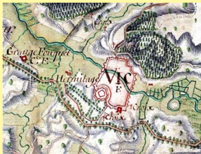
Carte des Naudin : environs de Vic-sur-Seille

Ces cartes ne doivent pas occulter l'existence de cartes aux ambitions plus modestes mais aux motivations nouvelles comme les cartes d'arpentage, de délimitation de propriétés, de gestion de bien qui se multiplient dans la seconde moitié du dix-huitième siècle. Pour reprendre l'analyse de Monsieur Jean-Pierre Husson, les représentations sont alors les témoins du passage « des droits attachés à des titres, à des droits référés, à des espaces ». Les procédés de