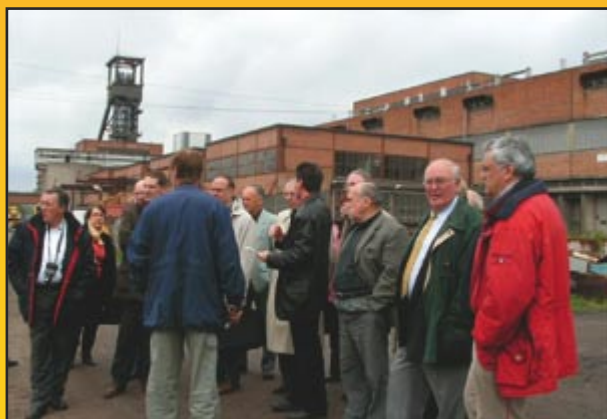
Au carreau Wendel, avec l'APIME