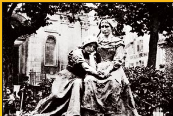
Le monument des Deux Sœurs de P. Dubois (Nancy).

La « ligne bleue des Vosges » devient une frontière, ce qu'elle n'avait jamais été jusque-là. Pendant quarante huit ans, dans ce cadre qui leur a été imposé, Alsaciens et Lorrains annexés partagent une communauté de destin. Dans la Lorraine demeurée française, celle de Saint-Dié, d'Epinal, de Nancy, de Bar-le-Duc, beaucoup d'Alsaciens émigrent et s'établissent pour rester des Français de France tandis que de nombreuses entreprises alsaciennes s'installent définitivement ou créent des filiales. Une seconde fois, de 1940 à 1944, l'Alsace et la Moselle sont annexées au Reich, devenu nazi.