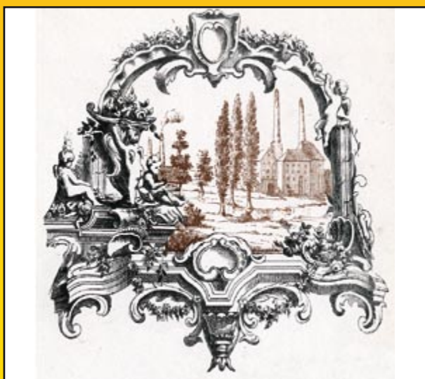
Atlas géographique, statistique et historique du département de la Moselle par L.B. de Saint-Martin, Metz, 1860. Cartouche représentant des installations industrielles.

Gardiennes de la mémoire du passé des départements, les Archives départementales sont aussi des sources incomparables de documentation, la base historique sur laquelle peuvent s'appuyer des politiques patrimoniales et touristiques.