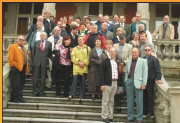
Les participants de la journée devant le château Utzschneider

Après le déjeuner, les représentants de onze associations des arrondissements de Sarreguemines, Forbach et Boulay ont exposé aux visiteurs leurs domaines d'intérêt et leurs réalisations.