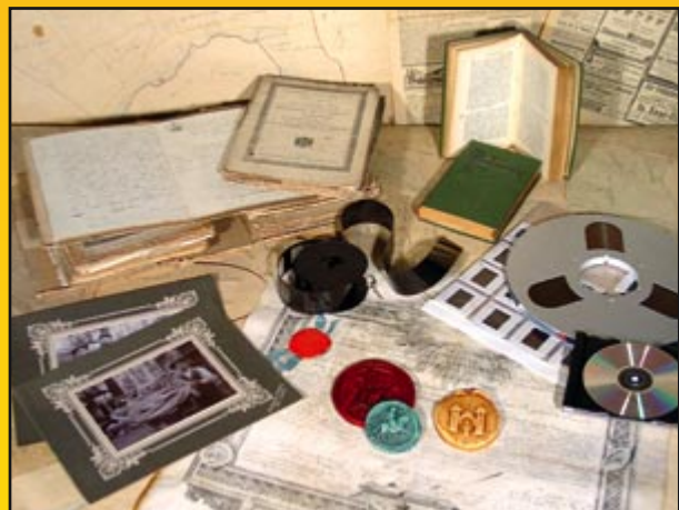
Les différentes catégories de documents conservés